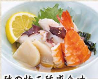
酢の物三種盛合せ