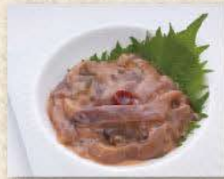
いか肝わさび和え

Sunomono sansyu moriawase (Assortment of three kinds of vinegared dishes)