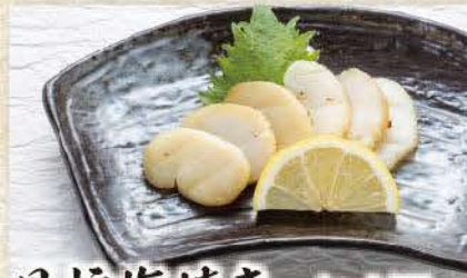
貝柱塩焼き たいらぎ貝