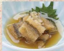
子持ち昆布付出し