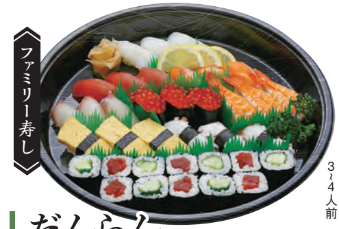
だんらん 5,000円 (税込5,400円) 3~4人前 8,000円 (税込8,640円) 5~6人前