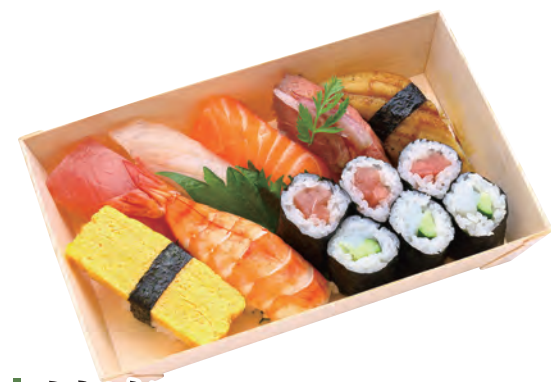
神楽 1,840円 (税込1,987円) 127×204×38mm