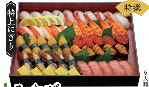
みやび 9,000円 (税込9,720円) 大トロ・うに入り 3人前 [27貫] 15,000円 (税込16,200円) 5人前 [45貫]