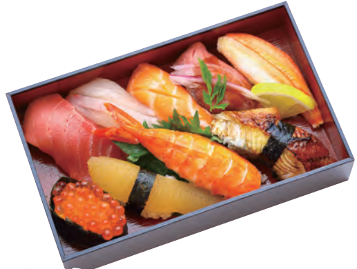
恵比寿 2,500円 (税込2,700円) 196×121×42mm