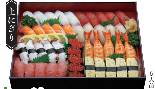
つどい 6,000円 (税込6,480円) 中トロ入り 3人前 [27貫] 10,000円 (税込10,800円) 5人前 [45貫]