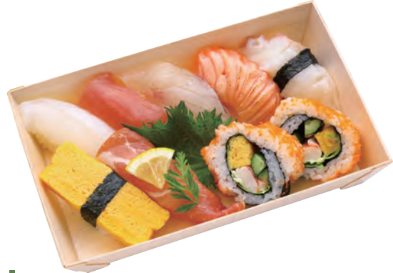
深川 1,500円 (税込1,620円) 127×204×38mm