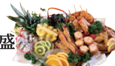
フルーッと 揚げ盛 (5人前)