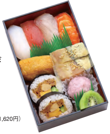
伝統の大阪寿しと にぎり寿しのコラボ 京橋 1,500円 (税込1,620円) 196×121×42mm