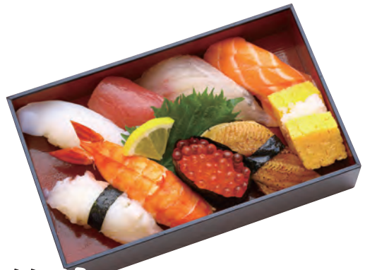
築地 2,000円 (税込2,160円) 196×121×42mm