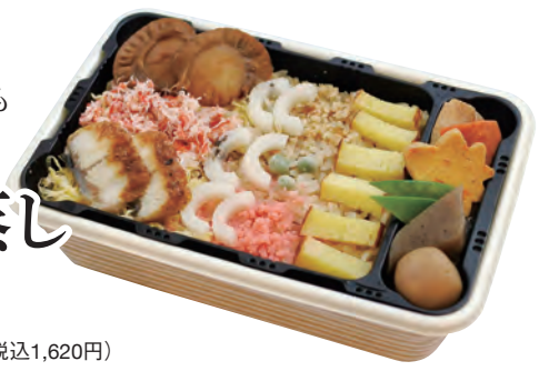
菊の蒸し 1,500円 (税込1,620円) 145×212×58mm