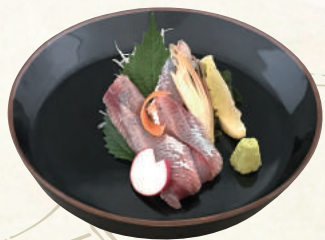
うるめイワシ刺身 700円