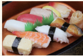
にぎり一人前 桜 1,000円