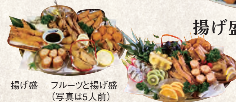
揚げ盛 フルーツと揚げ盛 (写真は5人前)